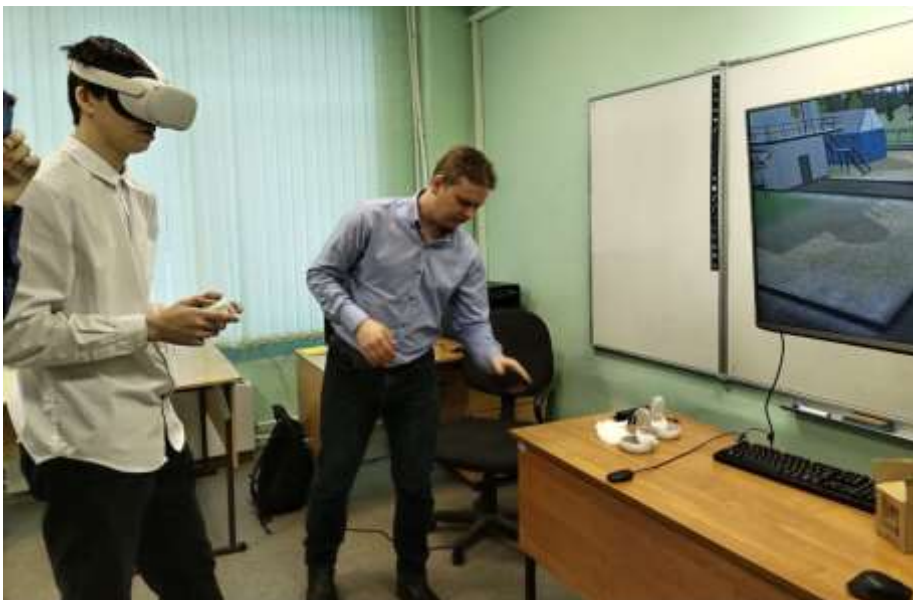
Осваиваем виртуальную реальность