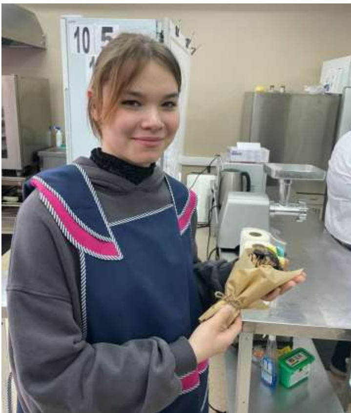
Профпробы в БУ «Няганский технологический колледж»