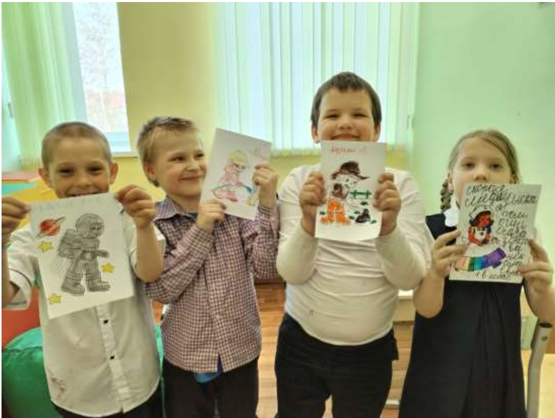
Профессия каждая самая важная