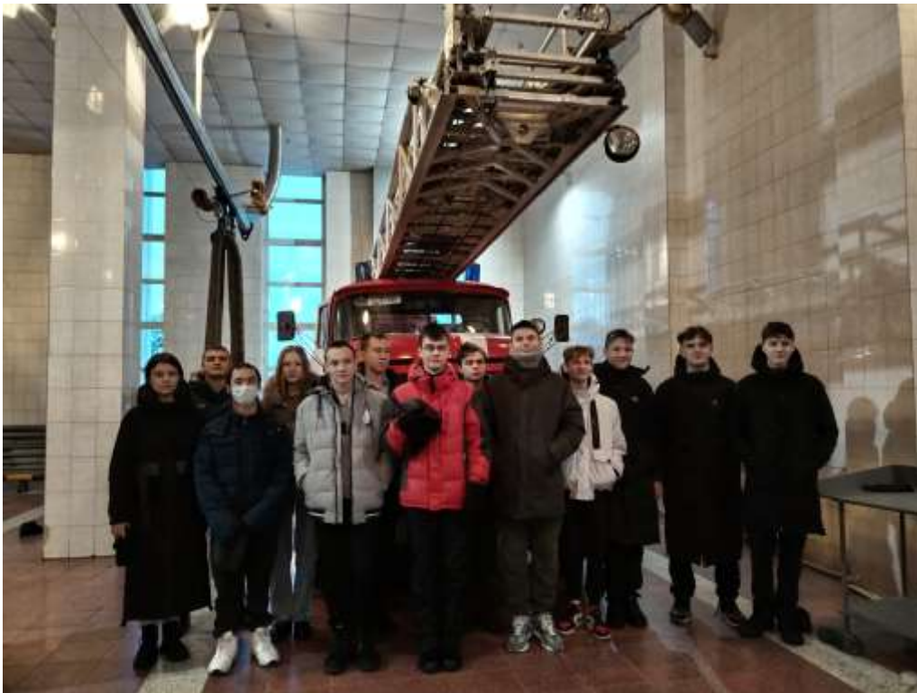
На экскурсии в пожарной части