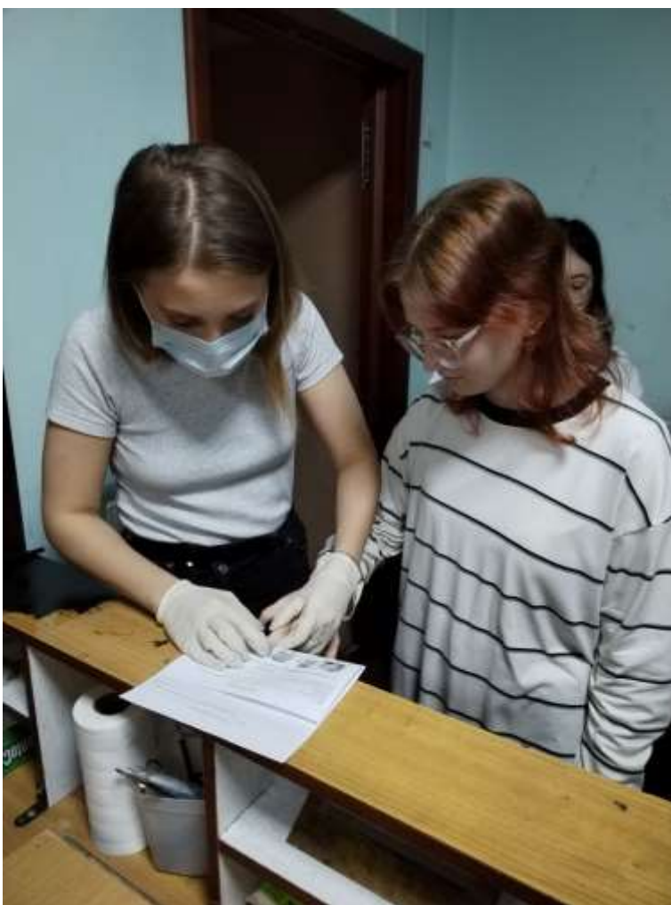
На экскурсии в отделении ОМВД