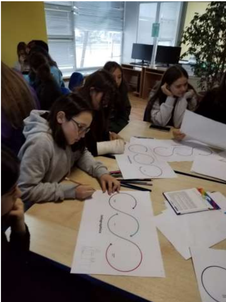
Профканикулы в Центральной библиотеке